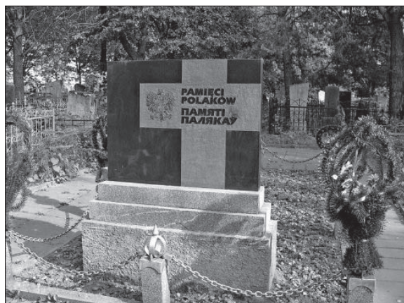
Помнік польскім ахвярам у Баранавічах