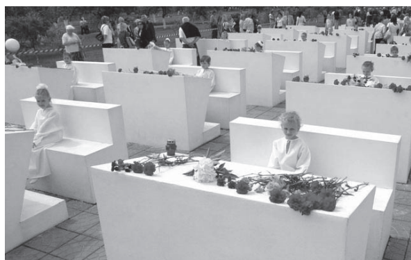
Мемарыял дзецям – ахвярам вайны “Красны Берэг”. 2007. Гомельская вобласць

Вянок ад прэзідэнта РБ А. Р. Лукашэнкі, ускладзены ў 2008 годзе каля помніка мінскага мемарыяла “Яма”