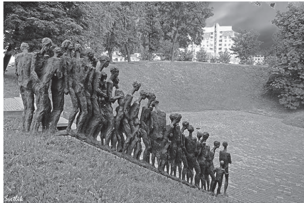
Мінскае ўрочышча “Яма” – сучасны манумент

Мінскае ўрочышча “Яма” – помнік савецкіх часоў на месцы масавага забойства нацыстамі яўрэяў Мінска