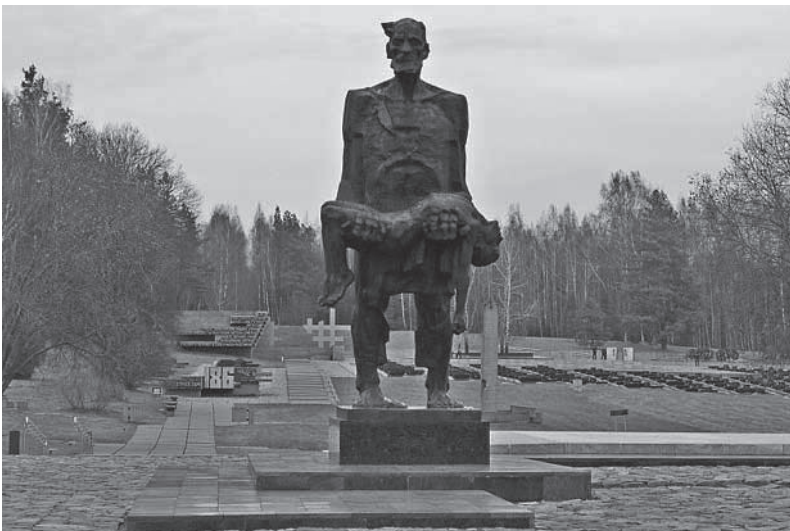
Мемарыял у Хатыні

Мінскае ўрочышча “Яма” – помнік савецкіх часоў на месцы масавага забойства нацыстамі яўрэяў Мінска