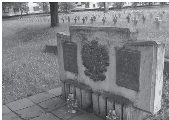
Польскія могількі ў Гродне