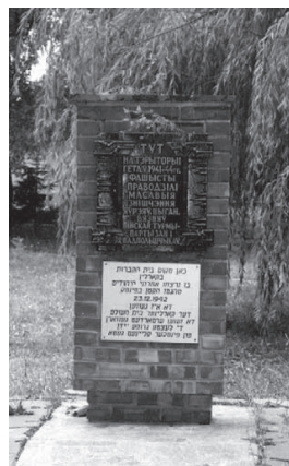
Помнік у Пінску на месцы масавага забойства нацыстамі яўрэяў, цыганоў, партызанаў і падпольшчыкаў