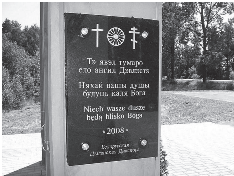
Помнік знішчаным у генацыдзе цыганам. Мемарыял Калдычава